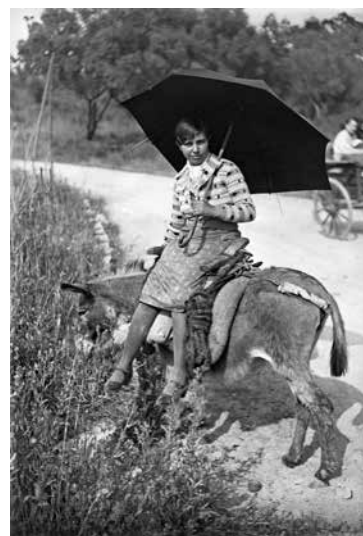
Circulation à dos d'âne sur les routes en Corse, 1933