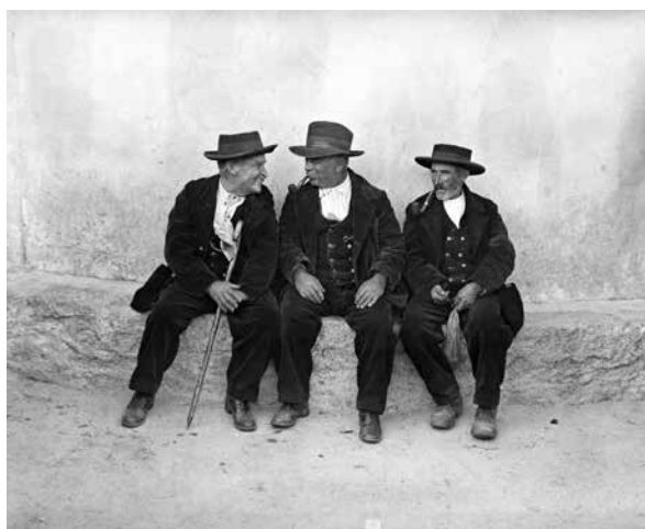
Piana, le dimanche : personnages typiques autour de l'église, 1933