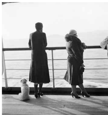
Sur le bateau entre Marseille et la Corse, mai 1933