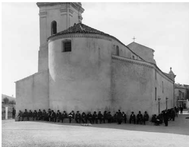
Hommes assis à l'ombre du chevet de l'église, Piana, 1933