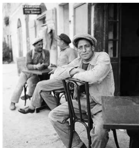
Pêcheurs assis à la terrasse d'un café, Bonifacio, 1933