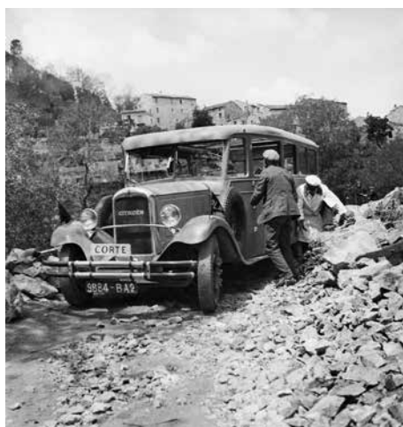
Automobile bloquée par des blocs de rochers roulés sur la route, Corte, 1933