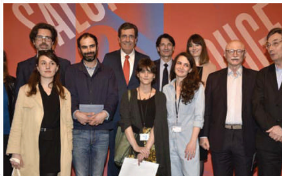
Photo de groupe avec les trois lauréates des Prix du 61 e Salon de Montrouge.