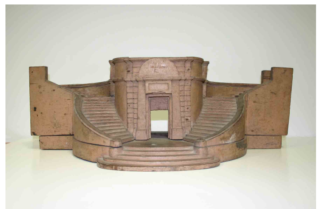
Escaliers des Terreaux Vauban