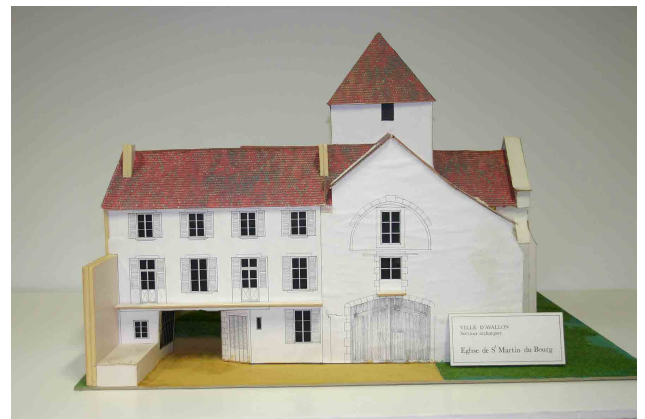
Eglise Saint-Martin du Bourg

Deux maquettes relatives aux terreaux Vauban sont plus anciennes, dont le premier projet d'aménagement (1866) de la Place qui encadrera sa statue Vauban par le célèbre sculpteur Bartholdi ; celui-ci travaillait durant la même période sur deux sculptures monumentales qui affirmeront sa célébrité : la statue de la Liberté à New-York, et le Lion de Belfort.