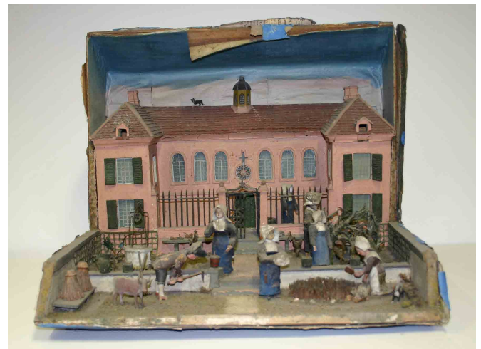
La façade l'Hôpital d'Avallon vers 1800

Pourtant, si elle est présente dans les collections, c'est qu'elle a forcément un lien, tenu il est vrai, avec l'histoire de notre ville... A nous de le découvrir parmi nos nombreuses archives.