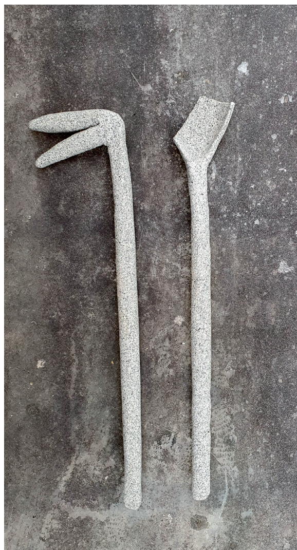
Centre Hospitalier Vauclaire, outils en pâte de granit, 2020.