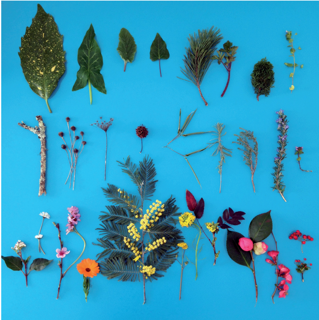
Herbier, Hiver, Centre Hospitalier Vaucraire, 2020. ©Fanny Maugey.

Couverture : Âne, lièvre, ours ©Fanny Maugey.