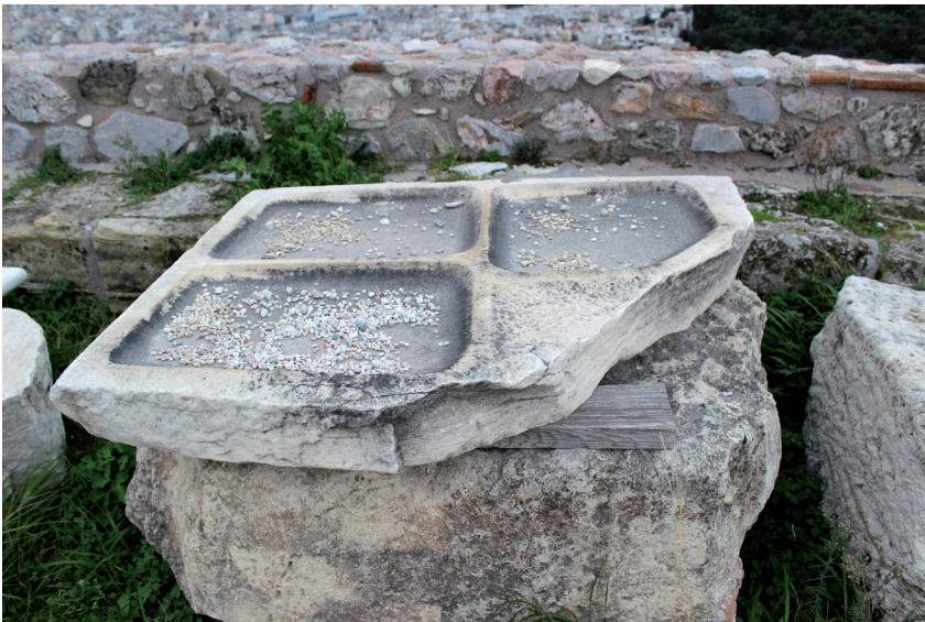
Réceptacle , Athènes, 2018.

Extrait de Florence Meyssonier, « Fanny Maugey », in Cahier du 19 , octobre 2020.