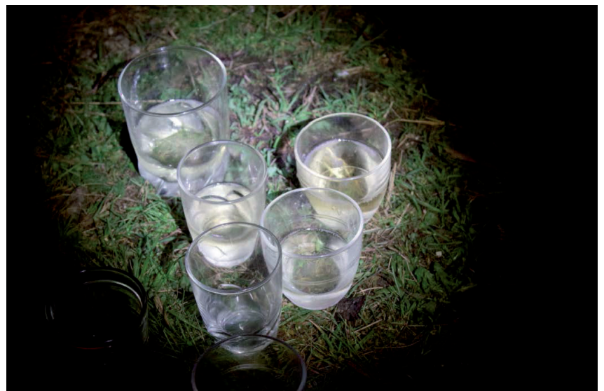
Fraîcheurs , 2017.

Plus d'informations sur www.le19crac.com