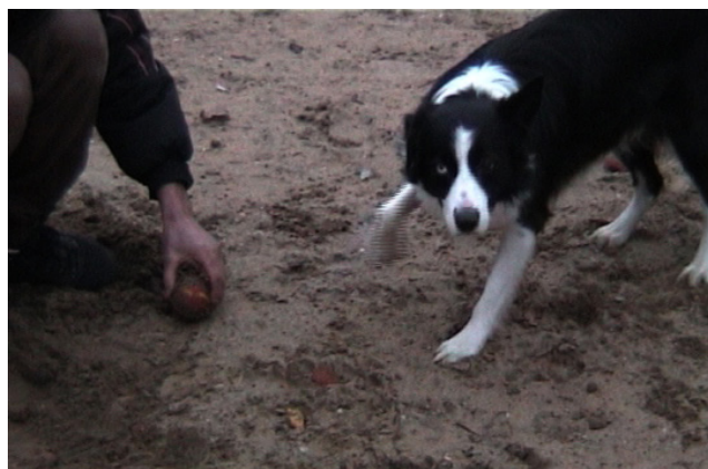
Paulien Oltheten, Man and Dog (2002) Collection Frac Normandie Caen

Diffusion de la vidéo Man and Dog de Paulien Oltheten.