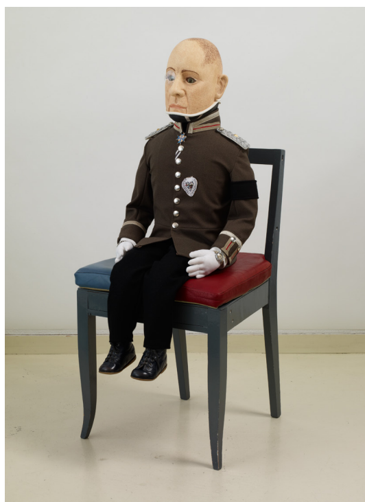
Michel Aubry, La Marionnette Erich (2008) Collection Frac Normandie Caen