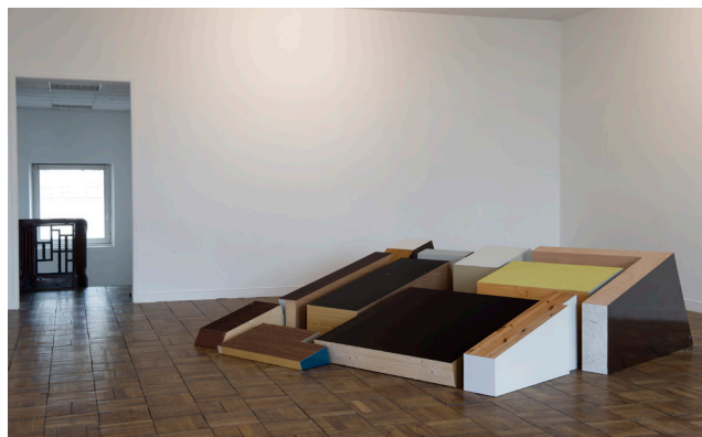
Séverine Hubard, Demi-République (2014) Collection Frac Normandie Caen

Exposition de l'œuvre Demi-République de Séverine Hubard, réalisée lors de l'exposition personnelle de l'artiste au Frac On n'a jamais été si proche (2014).