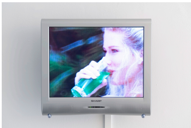
Claude Closky, Extrait de 200 bouches à nourrir (1994) Collection Frac Normandie Caen