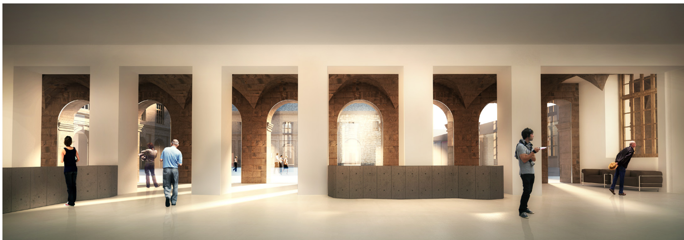
Perspective intérieure sur l'espace d'accueil © Agence Rudy Ricciotti