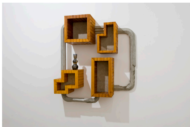
Wilfrid Almendra, Killed in Action (2009) Collection Frac Normandie Caen

Collection Frac Normandie Caen et Commande publique du Ministère de la Culture et de la Communication