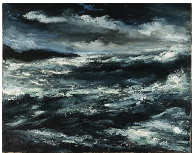
Maurice de Vlaminck Marine Huile sur toile Musée des beaux-Arts de Caen

Eloignée de la capitale et d'accès peu aisé, la presqu'île du Nord-Cotentin est demeurée à l'écart des grands itinéraires artistiques normands. Cité industrielle en pleine expansion, Cherbourg accueille au XIX e siècle un afflux sans précédent d'ouvriers. A l'instar des autres villes normandes, Cherbourg sacrifie à la mode des bains de mer en 1828 et construit un casino en 1864. Le réseau ferré qui permet de relier Cherbourg à Paris est inauguré en 1858. En dépit de ces infrastructures, la région demeure peu fréquentée. Pourtant une poignée d'artistes dits d'avant-garde ont posé leurs chevalets dans cette région : Eugène Boudin, Auguste Renoir, Paul Signac, Albert Marquet, Berthe Morisot.