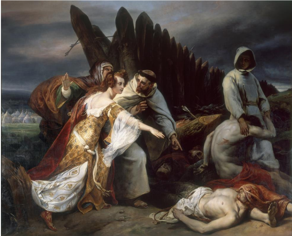
Horace Vernet Edith retrouvant le corps d'Harold après la bataille d'Hastings Huile sur toile