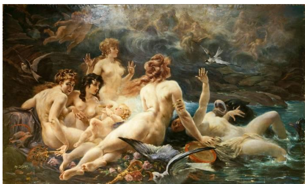
Adolphe La Lyre Les sirènes visitées par les muses Huile sur toile

Pour les affamés d'art, le musée vous propose, sur le temps du déjeuner, une courte visite d'une demi-heure autour d'un artiste, d'une œuvre ou d'un espace emblématique du musée.