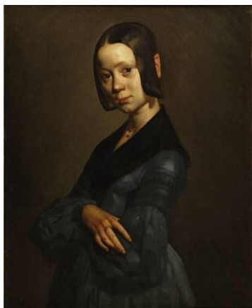
Jean-François Millet Pauline Ono en bleu Huile sur toile