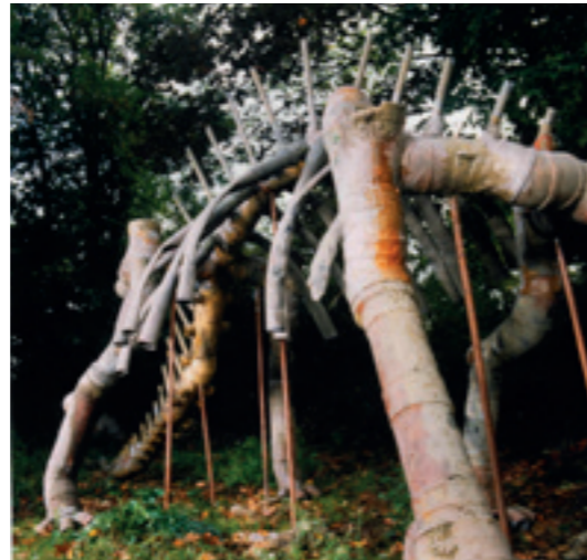
SCULPTURE PVC DINOSAURE - 1991