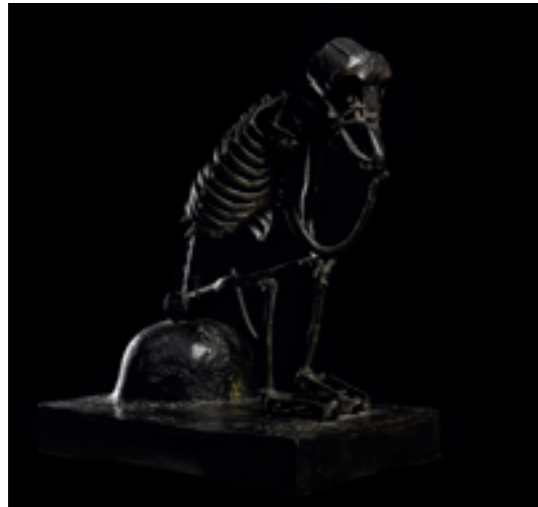
VELOBIPÈDE HOMMAGE À RODIN - BRONZE - 1995