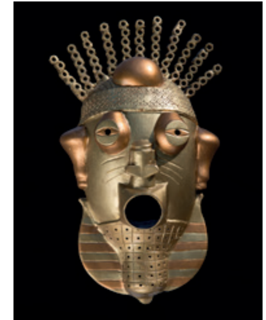
MASQUE D'OR - FER ET BRONZE - 2008