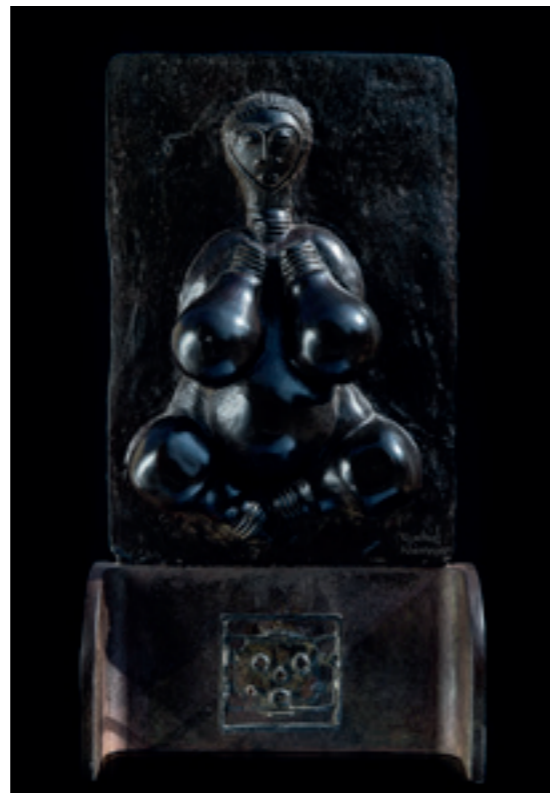
LA DÉESSE DE L'AMOUR - BRONZE ET FER - 2008