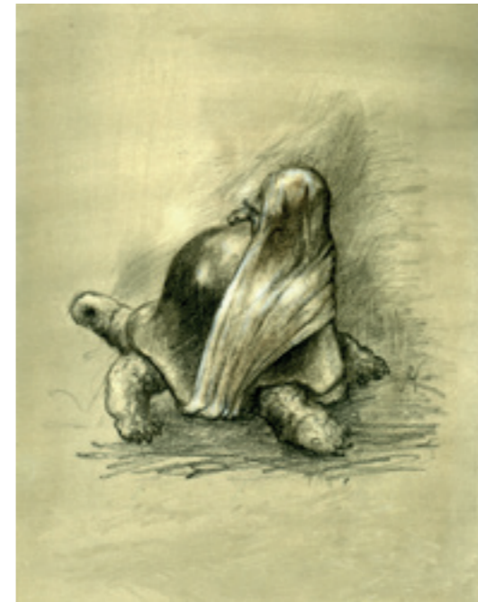
M PORTEUSE CRAYON NOIR ET BLANC - 1994