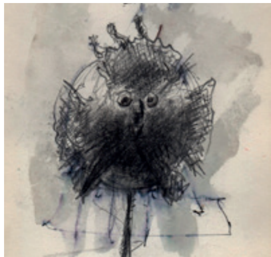
POISSON-BULLE - 1997