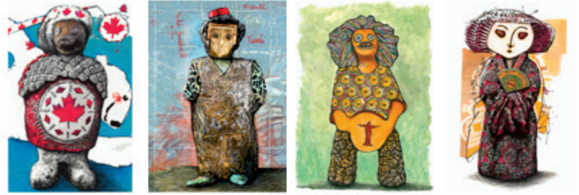
AKAVAK LE CANADIEN, ALI LE TUNISIEN, ANTONIO LE BRÉSILIEN, AYAKO LA JAPONAISE