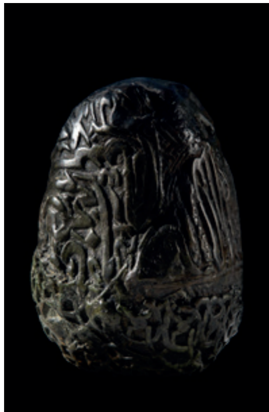
SCULPTURE OEUF AVEC CALLIGRAPHIES BRONZE - 1993