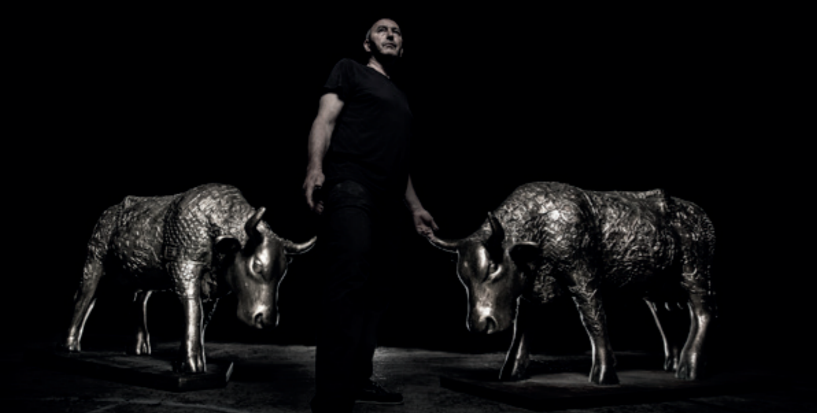
Portrait de l'artiste avec les vaches - 2017