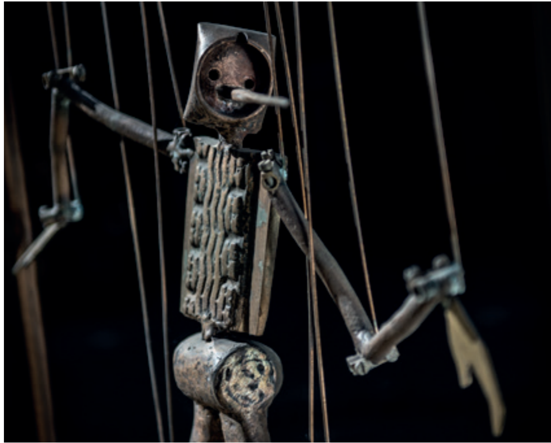
Pinocchio Bronze détails - 2003