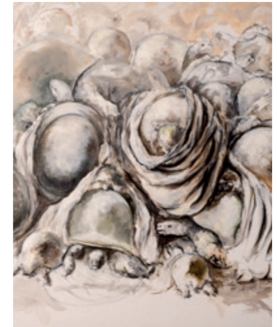
PEINTURE À L'HUILE - 2017