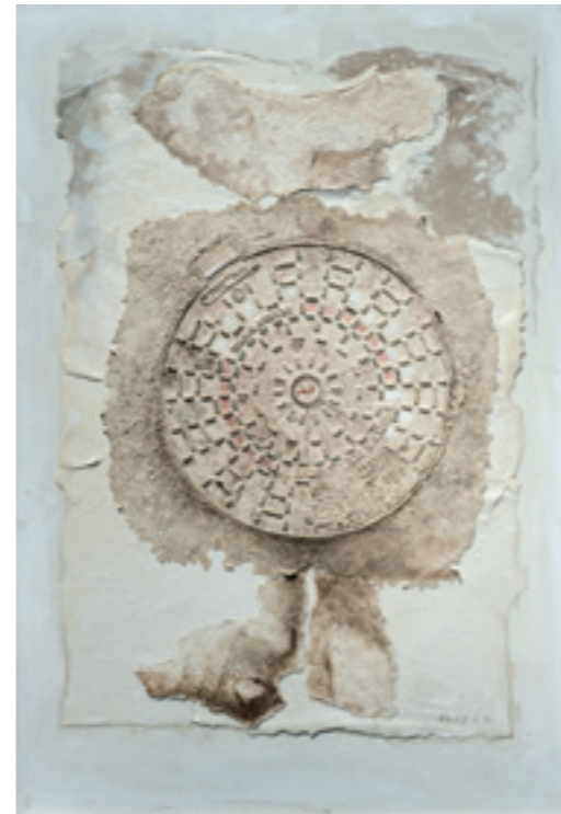
TAOUFIK - RELIEF PAPIER - 1983