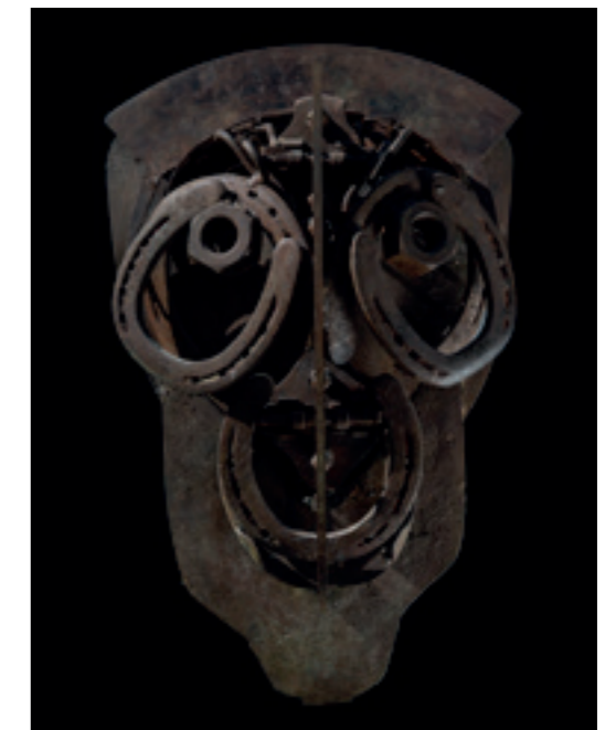
MASQUE BARTA - FER - 1998