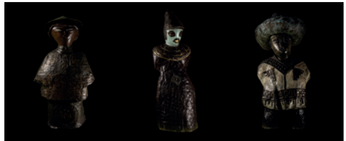
MU NAN - BRONZE PEINT