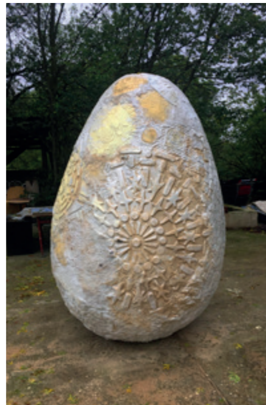
OEUF FINITIONS AVANT PATINE - 2017