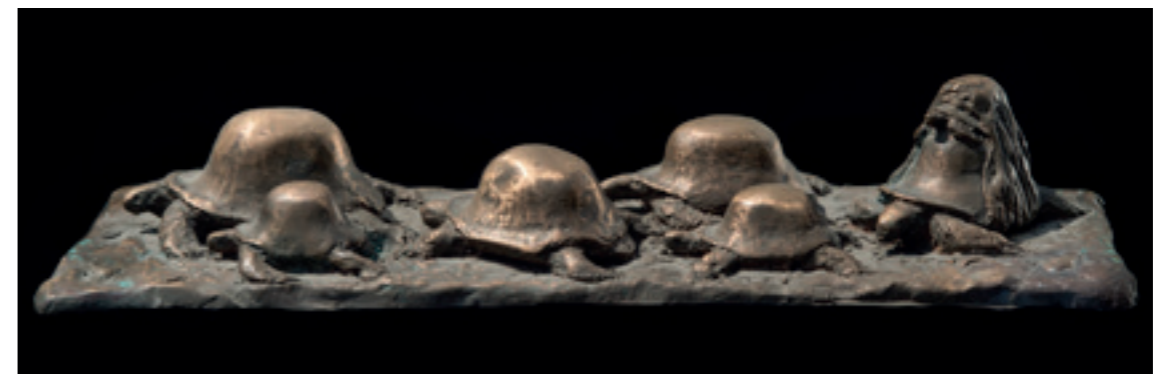
LA PROCESSION BRONZE - 1995