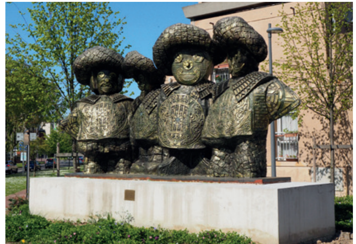
EVRY LES 4 MOUSQUETAIRES - 2013

1987 Relief terre cuite « Tampons et Regards », bureau de poste de Limoges-Beaubreuil. France Relief mural, New-York. USA « Don Quichotte et Sancho Pança », Sculpture monumentale en résine, Stains. France Relief mural en terre cuite, centre de formation, Dugny. France Relief-portrait, Pau. France « Les Guerriers », sculpture fer et résine, Parc Olympique de Séoul. Corée du Sud « L'enfant », sculpture, entreprise Pont-À-Mousson, Nancy. France Relief mural, école des beaux-arts de Hangzhou. Chine « L'extraterrestre », Neuchâtel. Suisse 1986 Réalisation d'un relief mural à Besançon. France 1985 Relief-portrait, Toulouse. France Intervention à la Fondation Claude Pompidou à Trégnac et réalisation d'un relief mural en résine à Tulle. France Sculpture monumentale fer et résine, Blanc mesnil. France 1984 Achat d'une œuvre par le FNAC – Toile 120F Calligraphies parisiennes