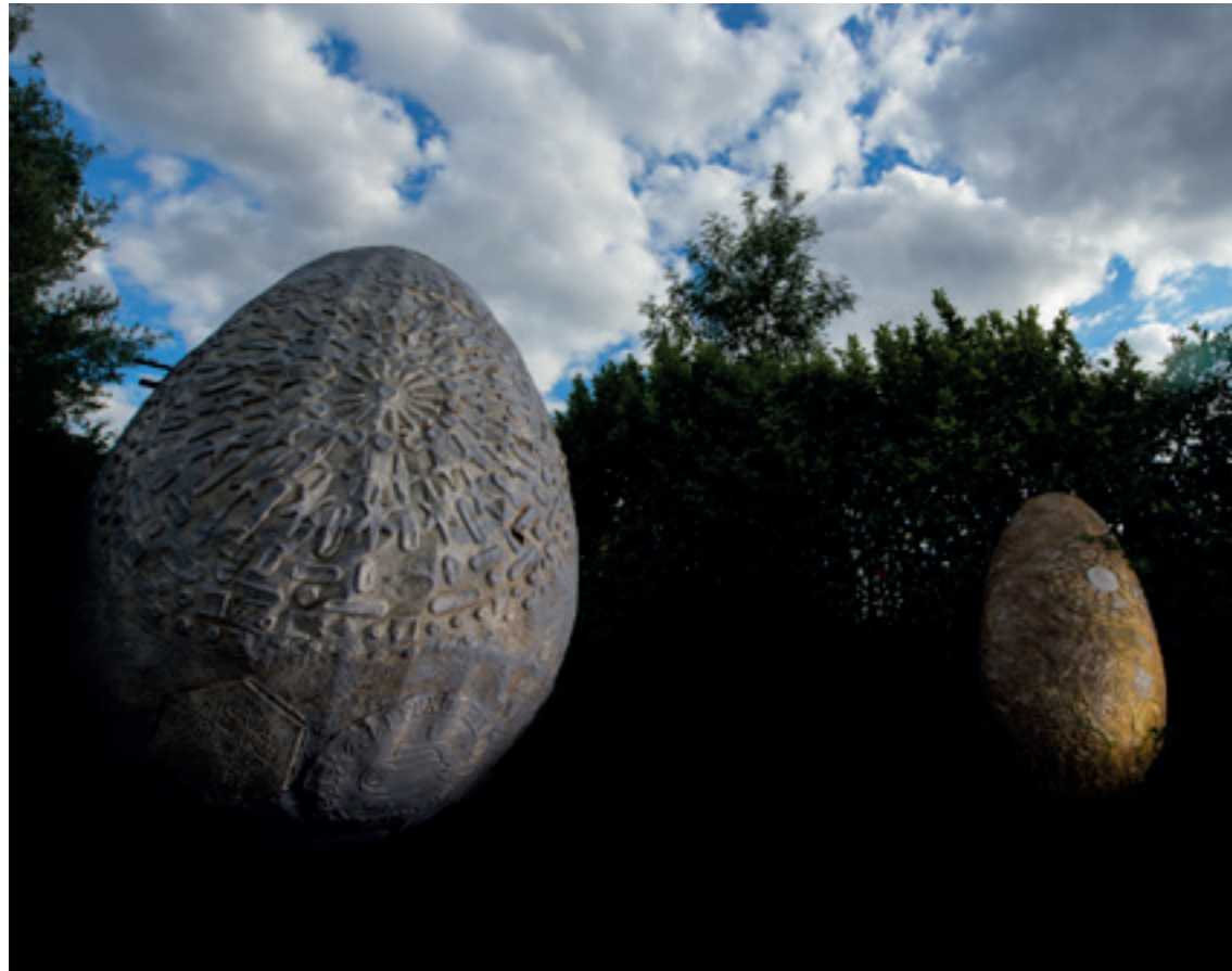
LES ŒUFS RÉSINE - 2017