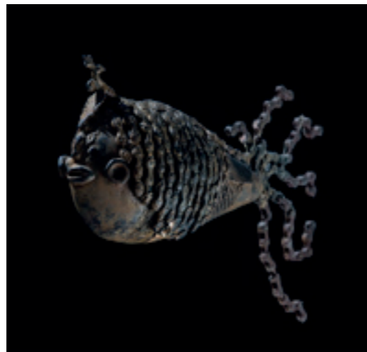
Poisson Rasta Bronze - 1996