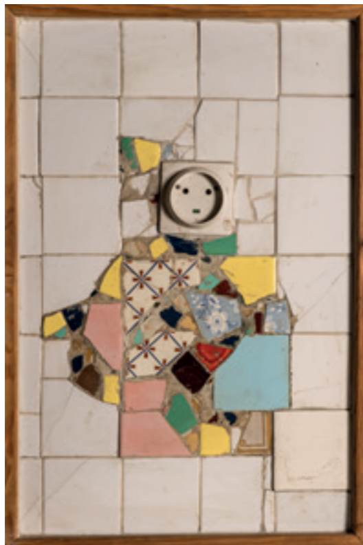
LA POUPÉE - CARRELAGE - 1989