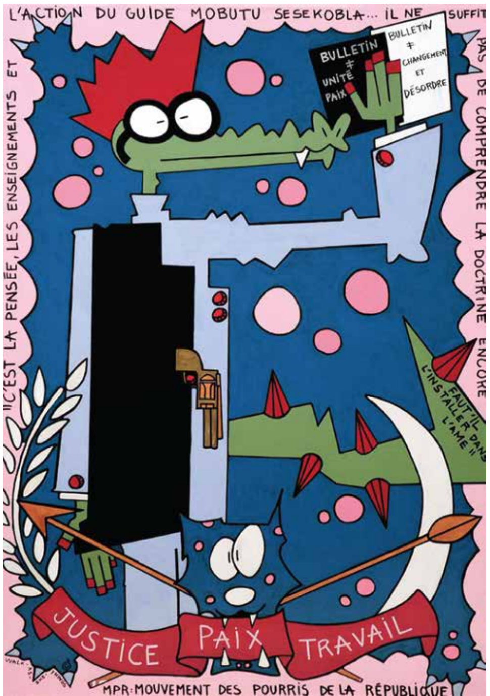
Série grands hommes de Bla, « Mobutu sesekobla », acrylique et posca sur toile, 101 x 70 cm, 2013