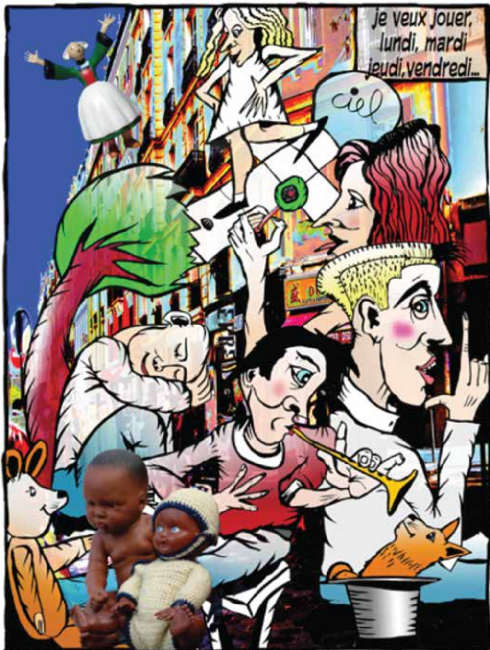
« Je veux jouer », technique mixte, 130 x 97 cm, 2012