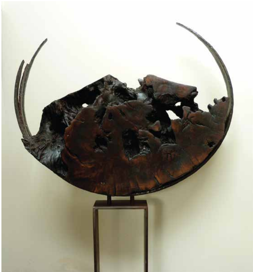
« Sans titre », Chêne brûlé, acier, 195 x 85 x 30 cm, 2013