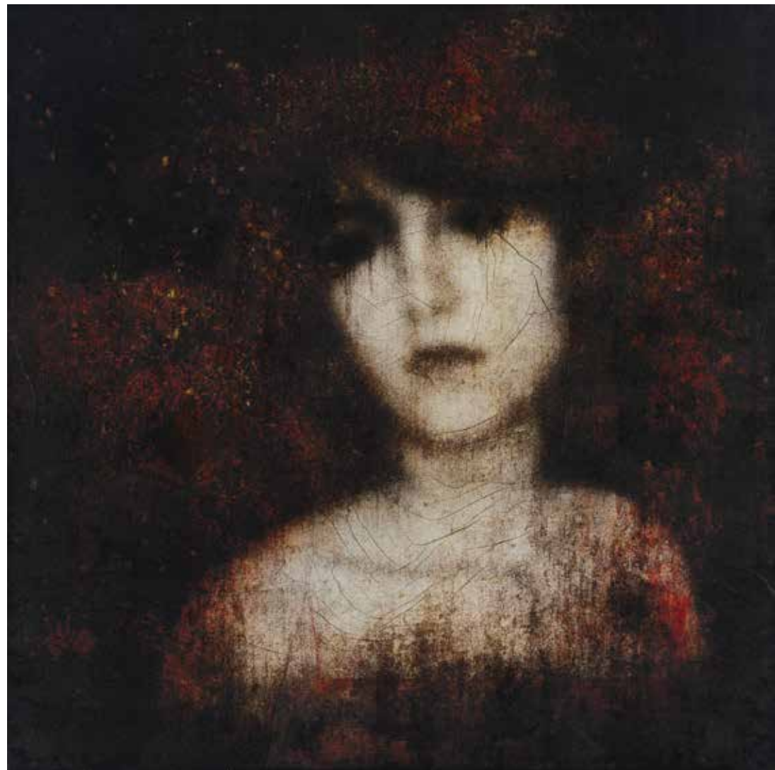
« Le grand voyage » , photographie et technique mixte, 80 x 80 cm, 2014