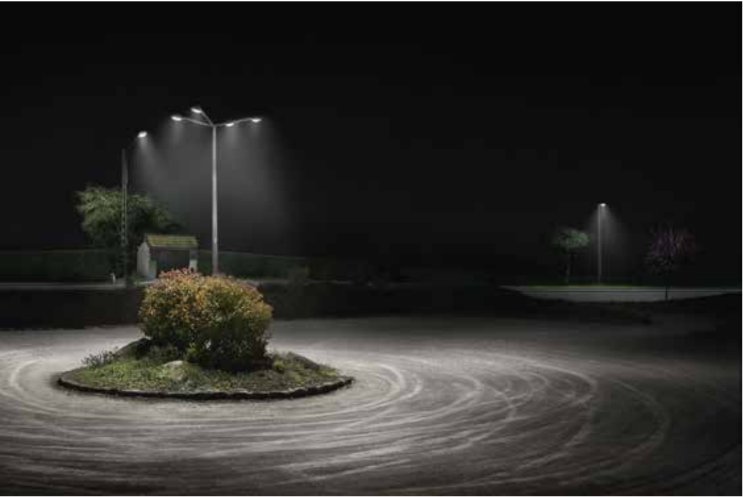
Série : « Réconfort d'une lumière dans l'obscurité », 60 X 80 cm, 2010