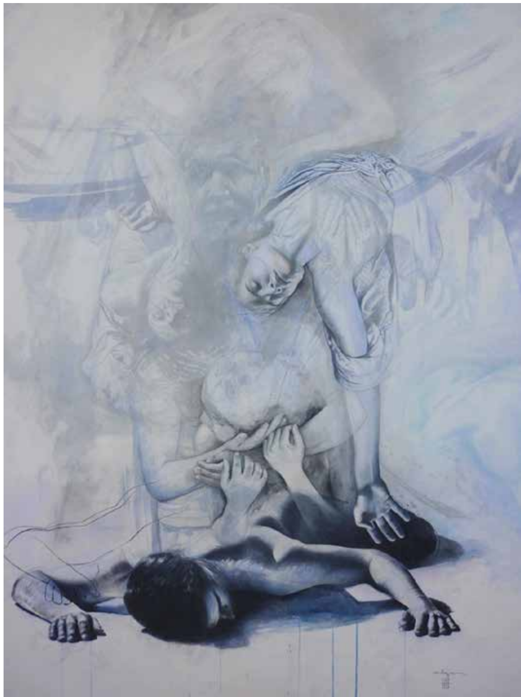
« Souvenirs et autres principes de gravités », 162 x 130 cm, acrylique, pigments et encres sur toile, 2011