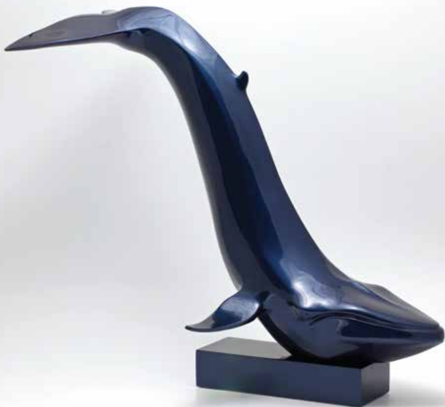
« Happy Jonah », bronze, h 70 cm, 2014