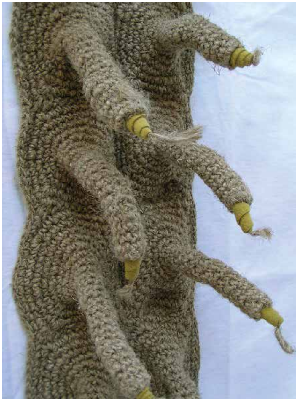
« Les germes y poussent », volume, lin crocheté et brodé, 30 x 30 x 170 cm, 2012