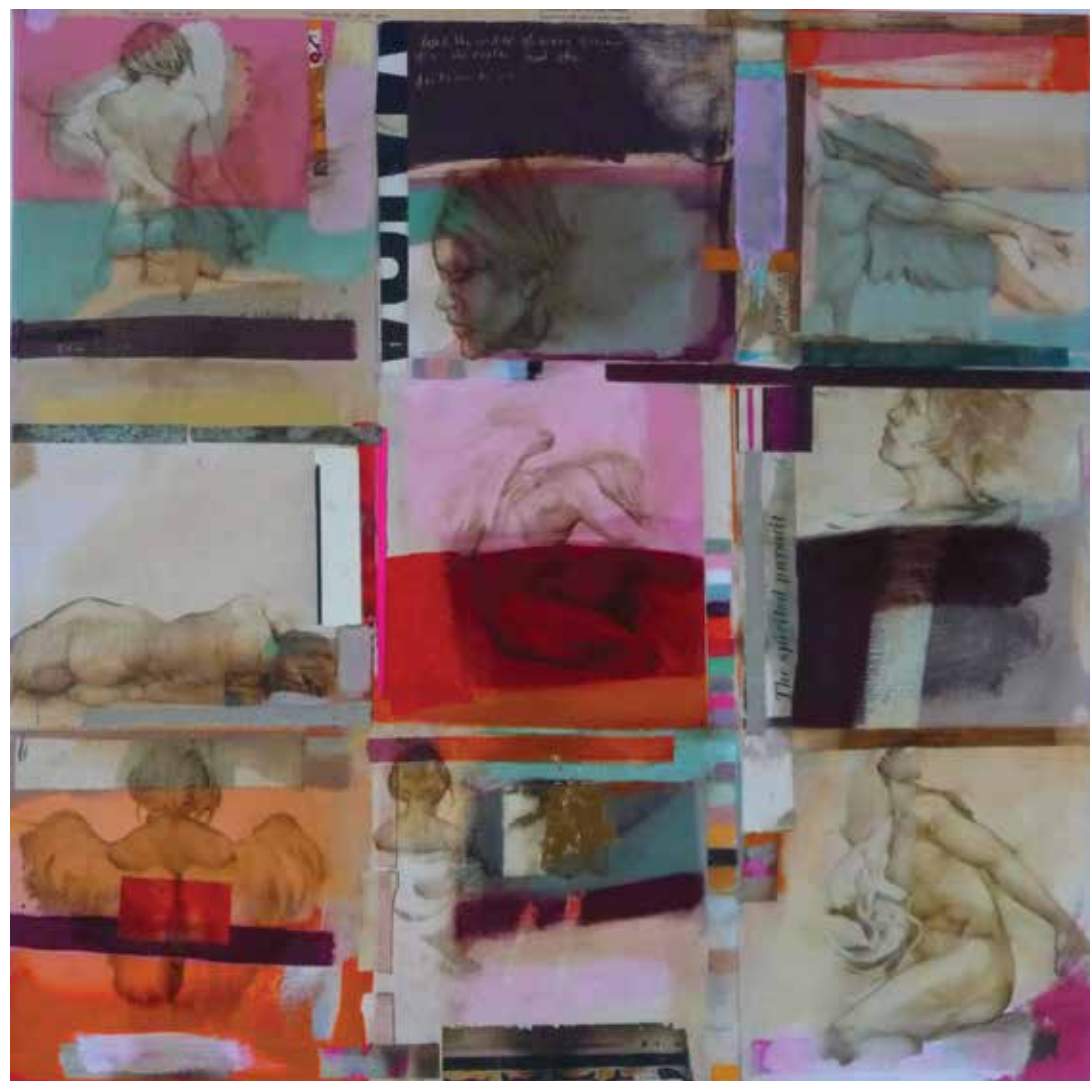
« Spirited pursuit of happiness », technique mixte sur toile, 60 x 60 cm, 2014