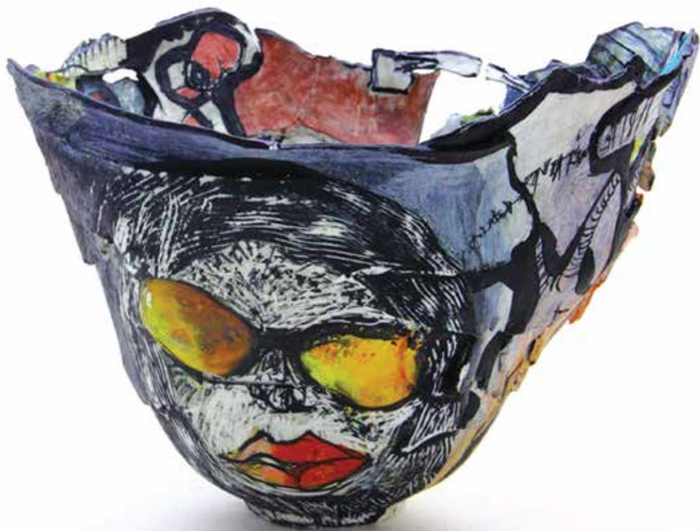
« Elle ira où elle veut » , porcelaine, 25 x 15 cm, 2013