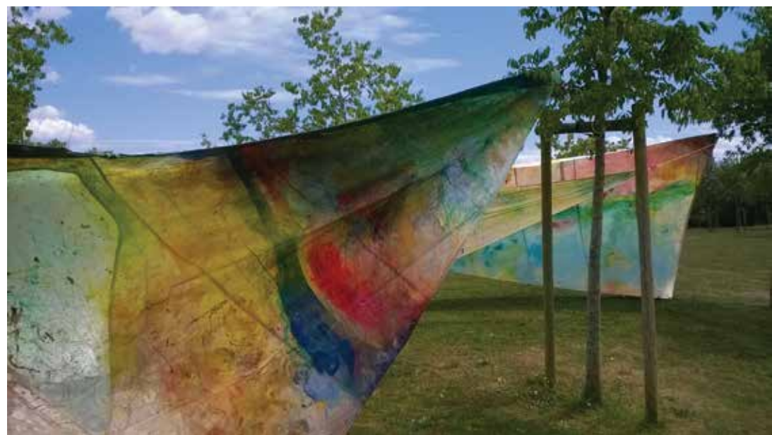
« Sans titre » , voile, 600 x 300 cm, 2013