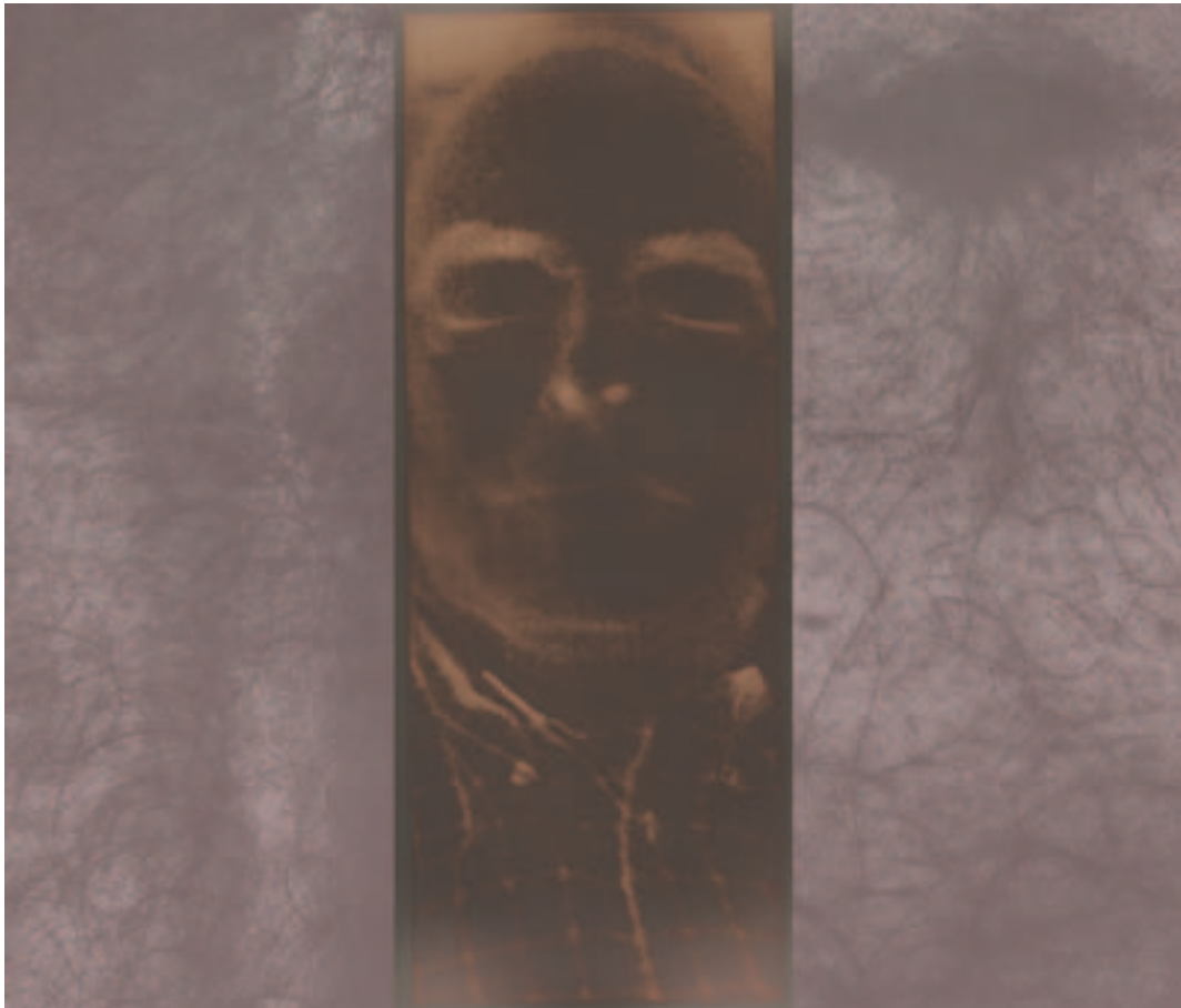
© - Alain Hervéou - 2014