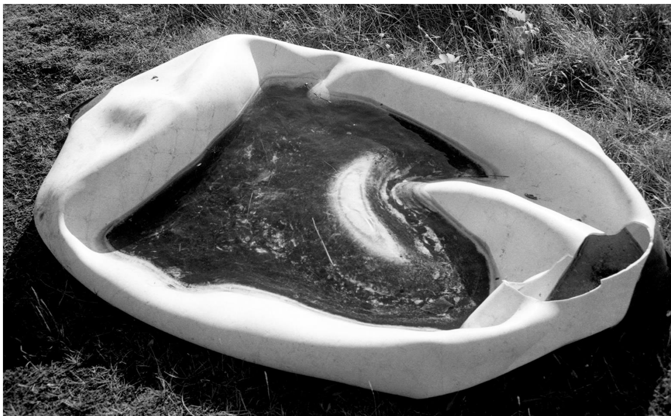
Série Sans-titre (2012) Sans titre n°16 - Tirage argentique sur papier satiné, 73x54 cm

« Tu me demandes d'écrire sur ton art qu'est-ce que je peux dire de ton art ?