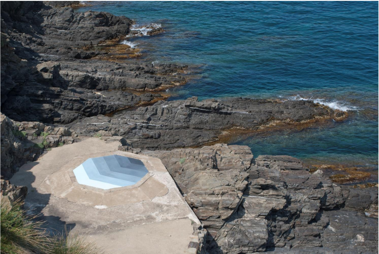
L'oeil du maelström , peinture à l'acrylique sur sol - Intervention dans l'espace public, pour la Manifestation d'Art Public # 6 Cerbère, France 2017 - Crédit photo : Rébecca Konforti