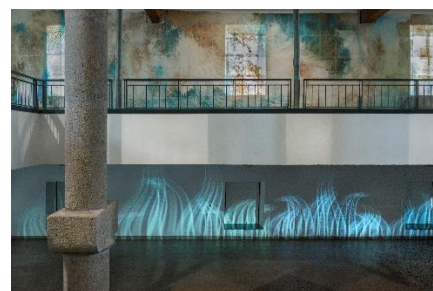
Vue de l'exposition Courant Continu à Agde - Collection Frac OM - 2018 - Photo Pierre Schwartz.