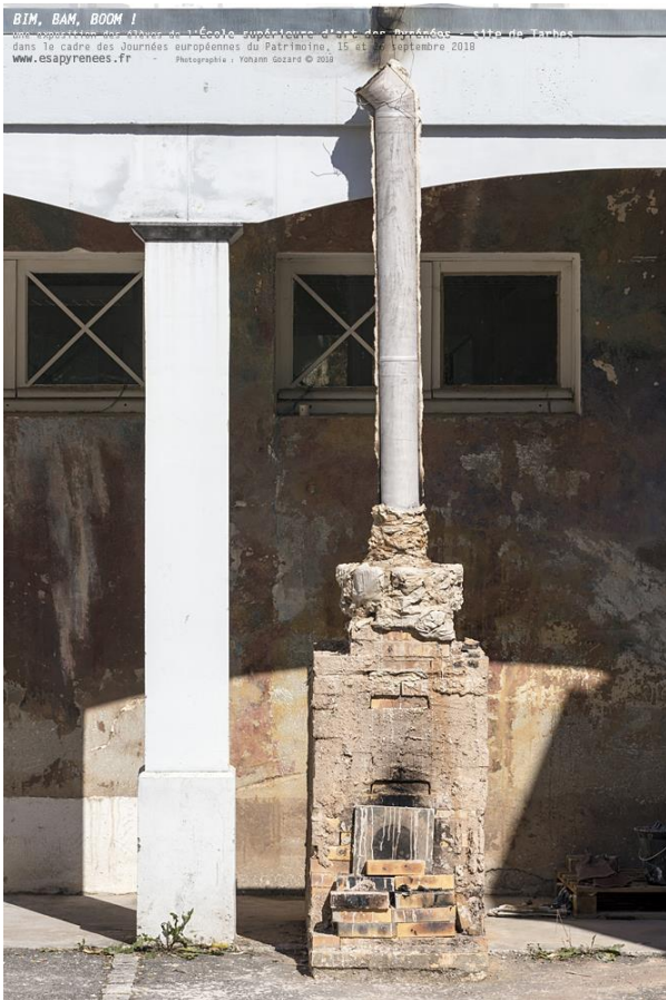
Extension d'un four – Sculpture - Ensemble de 4 sculptures, terre papier - 2 pièces dimensions : 220 x 25 cm - 1 pièce dimensions : 150 x 25 cm - 1 pièce dimensions : 120 x 25 cm