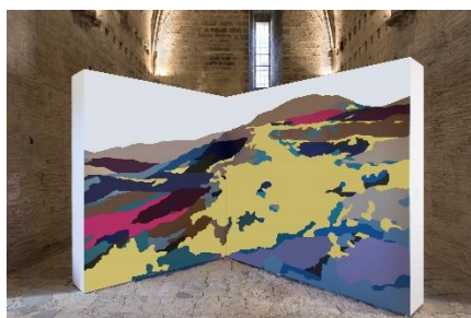
Pablo Garcia - Exposition Extensions de Graffitis , collection des FRAC, Fort Saint-André, Villeneuve Lez Avignon, 2018 - Collection Frac OM – Photo P. Schwartz.

Découvrez les Collections des FRAC en ligne : lescollectionsdesfrac.org · Projet Videomuseum