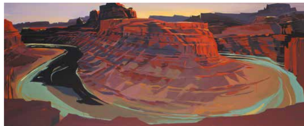
« Colorado » - N°25 - Potash Road - Acrylique sur toile 120 x 300 cm - 2001