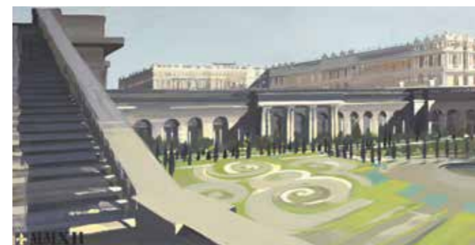
« Ma Vie de Château » - N°42 - L'Orangerie et le Château Acrylique sur toile 75 x 150 cm - 2012