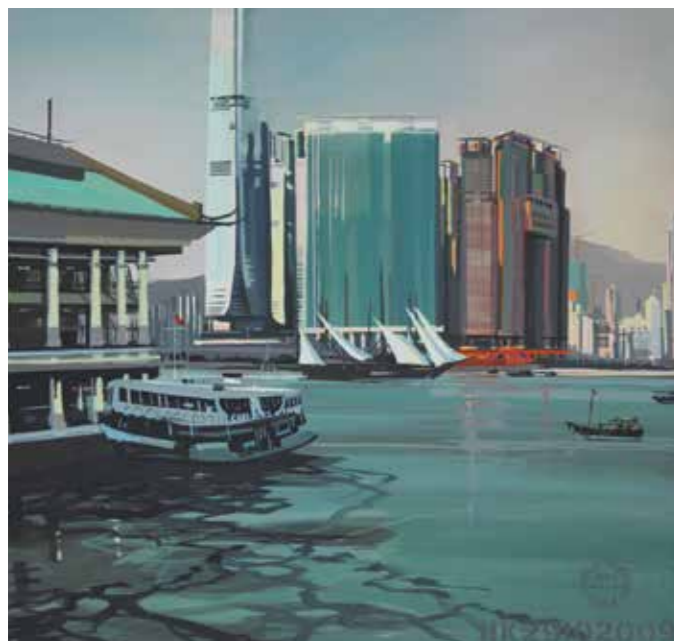
« Made in Hong Kong » - N°3 - Pier Central - 150 x 150 cm - 2009

Contact presse : Charles GUY : contact@charlesguy.com Tél. : 06 61 15 75 28 Dossier de presse : auboiron.com/presse/dp-auboiron-worldwide-2019 Images en téléchargement : auboiron.com/presse/photos-hd