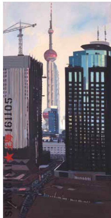
« Brut de Shanghai » - N°23 - Pearl Tower vue du studio - Acrylique sur toile 150 x 75 cm - 2005