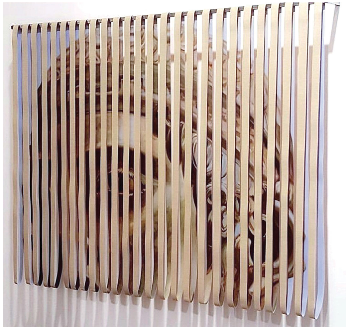
Coraline de Chiara, Tête antique , Huile sur toile et acier, 100 x 80 x 15 cm, 2019