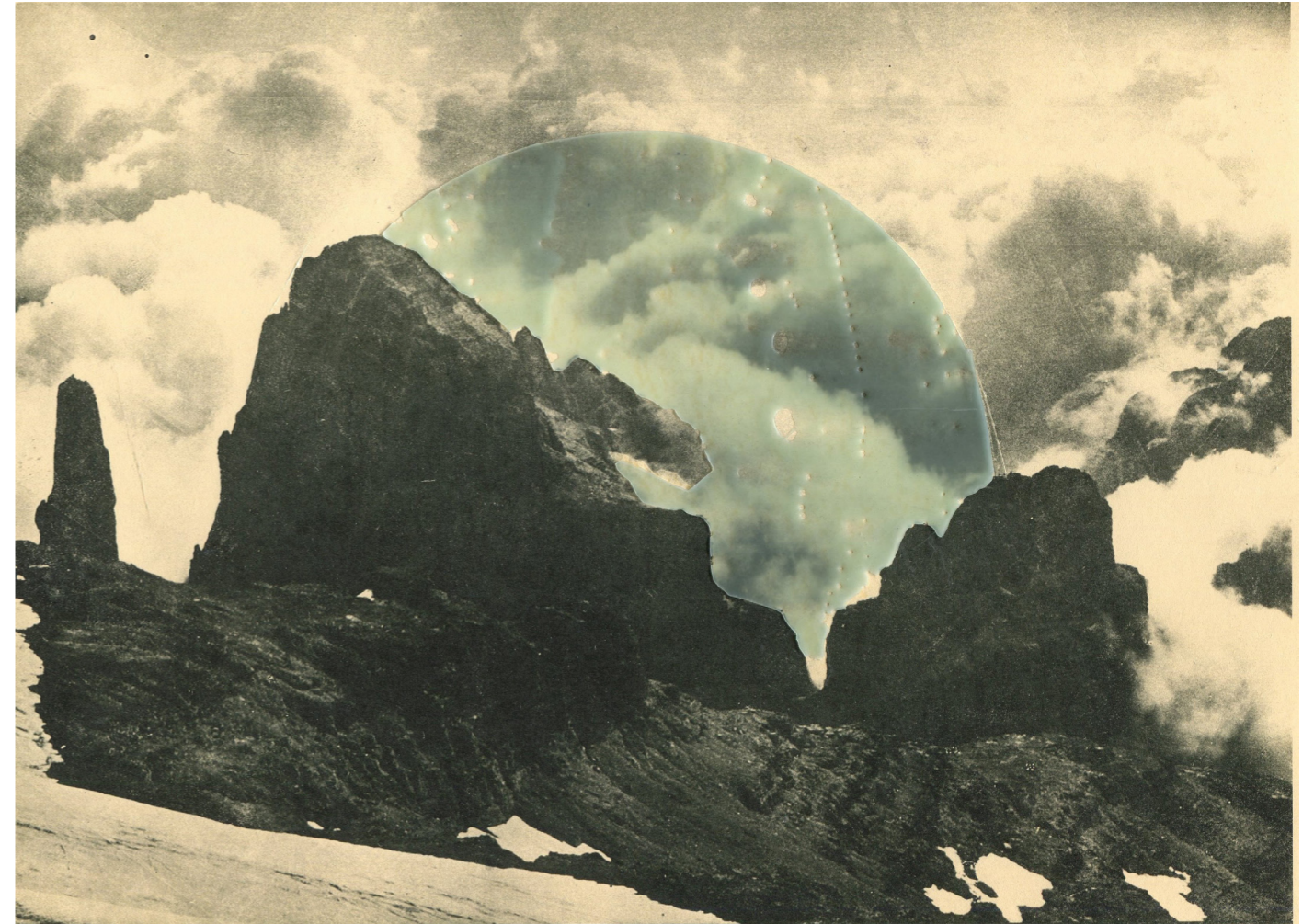
Coraline de Chiara, Reflection , techniques mixtes, 2019