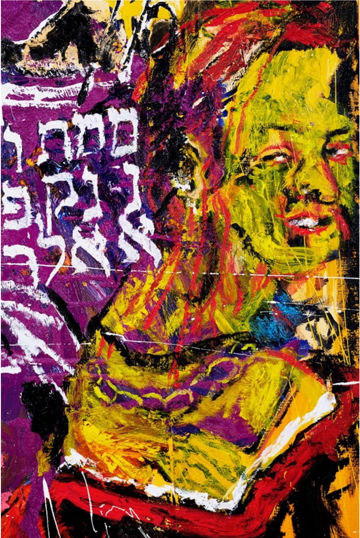
PROZESS (Detail) 130 x 195 cm / Huile & Glycero sur toile