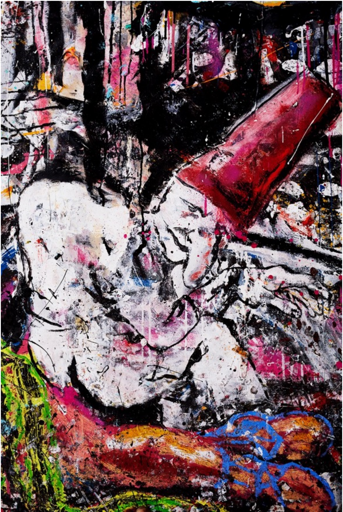
SLUAGHGHAI RM SPERM (Détail) 270 x 250cm / Techniques mixtes sur toile