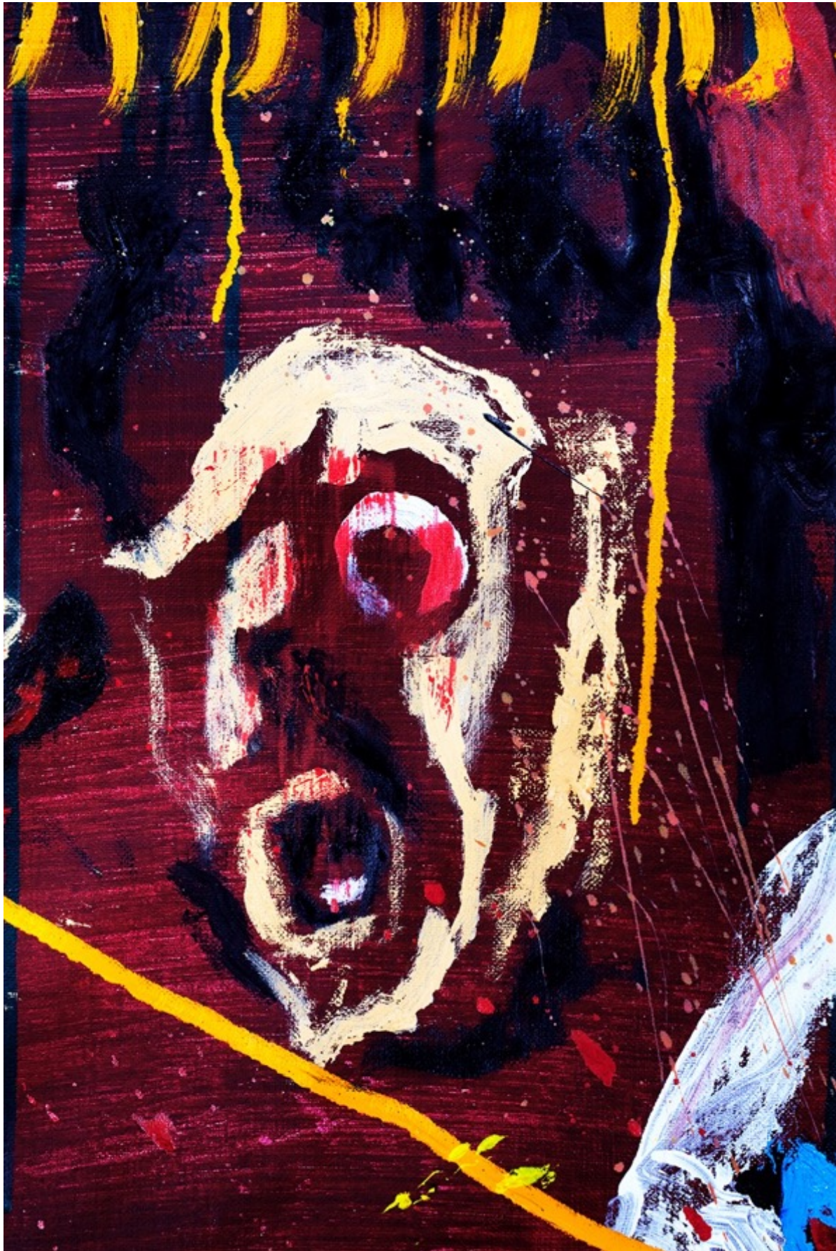
MITTE (Detail) 220 x 220 cm / Huile & Glycero sur toile