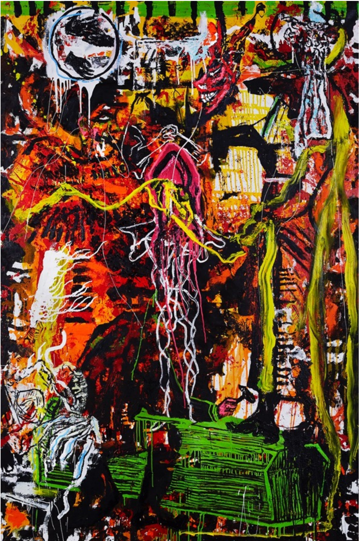
MÂÂT 210 x 140 cm / Huile & Glycero sur toile