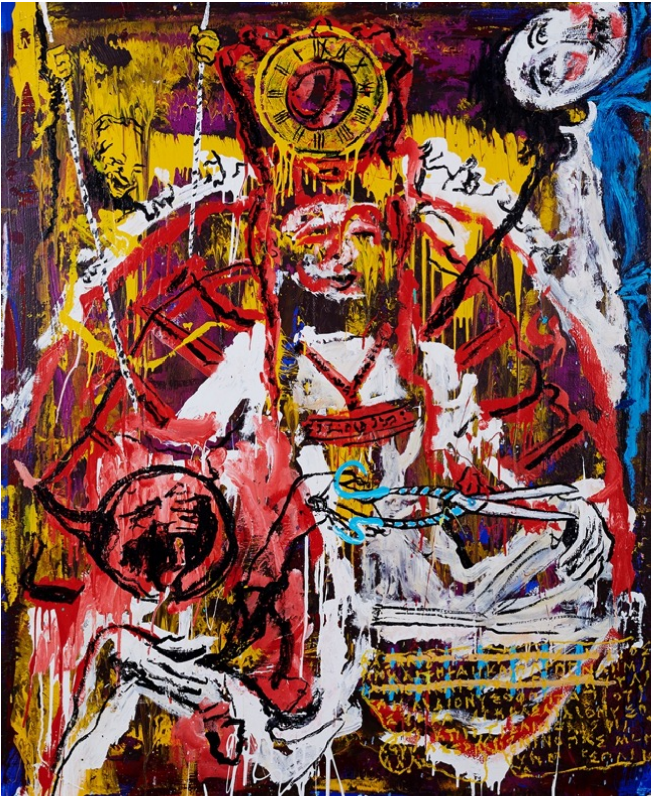
DEFIXIO 120 x 120 cm / Huile & Glycero sur toile