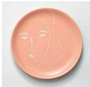
Assiette à dessert Nuance M2019HMB010 Dimensions : Ø 18 cm Hauteur : 2,5 cm Faïence peinte et gravée à la main