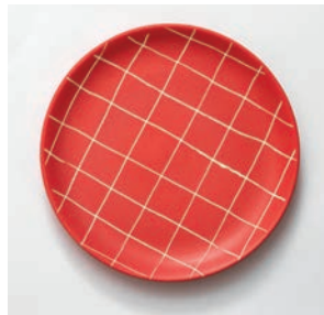
Assiette à dessert Carré M2019HMB011 Dimensions : Ø 18 cm Hauteur : 2,5 cm Faïence peinte et gravée à la main