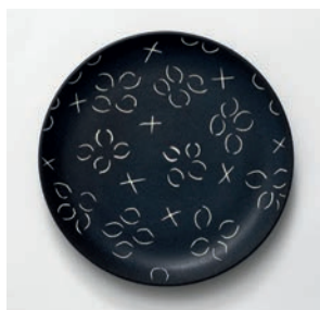
Assiette à dessert Double point M2019HMB013 Dimensions : Ø 18 cm Hauteur : 2,5 cm Faïence peinte et gravée à la main