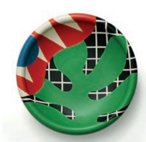
Plat Arpège M2019HMB004 Dimensions : Ø 37 cm Hauteur : 7,5 cm Faïence peinte à la main