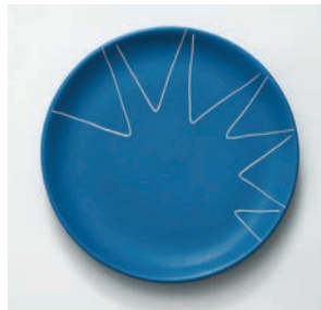
Assiette à dessert Contrepoint M2019HMB012 Dimensions : Ø 18 cm Hauteur : 2,5 cm Faïence peinte et gravée à la main