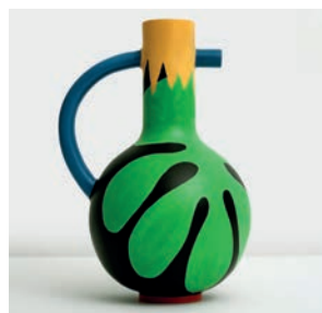
Cruche Octave M2019HMB008 Dimensions : Ø 21 cm Hauteur : 37 cm Faïence peinte à la main