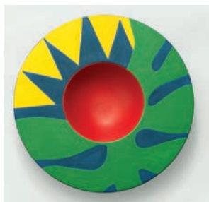
Plat Creux Sol M2019HMB003 Dimensions : Ø 37 cm Hauteur : 5,6 cm Faïence peinte à la main