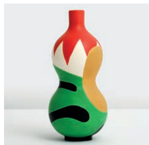
Bouteille Harmonie M2019HMB006 Dimensions : Ø 11,6 cm Hauteur : 25 cm Faïence peinte à la main