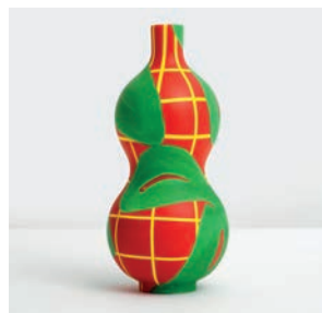
Bouteille Canon M2019HMB005 Dimensions : Ø 11,6 cm Hauteur : 25 cm Faïence peinte à la main