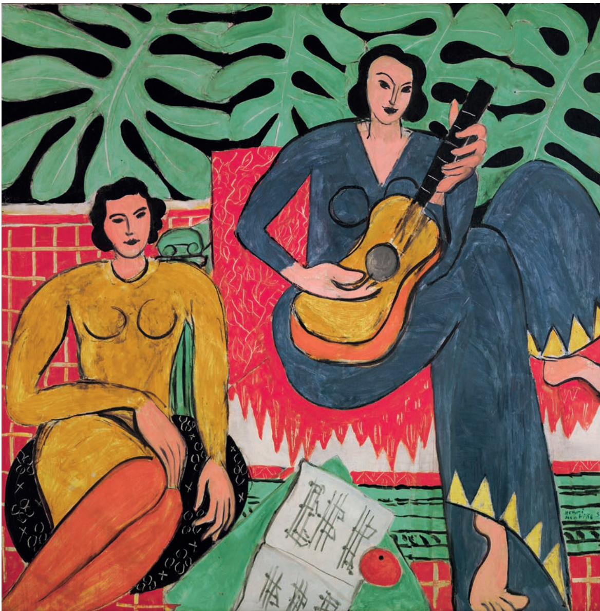
Henri Matisse, La Musique 1939 © 2020 Succession Henri Matisse

Comme un musicien, Matisse joue de son pinceau.