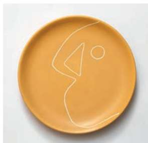
Assiette à dessert Clé M2019HMB014 Dimensions : Ø 18 cm Hauteur : 2,5 cm Faïence peinte et gravée à la main