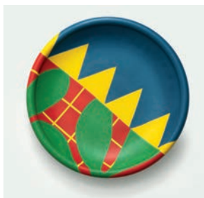
Grand plat Canon M2019HMB002 Dimensions : Ø 47 cm Hauteur : 7,5 cm Faïence peinte à la main