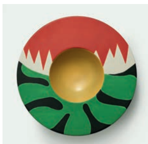
Grand plat creux Harmonie M2019HMB001 Dimensions : Ø 47 cm Hauteur : 8 cm Faïence peinte à la main