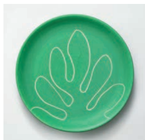
Assiette à dessert Variations M2019HMB009 Dimensions : Ø 18 cm Hauteur : 2,5 cm Faïence peinte et gravée à la main