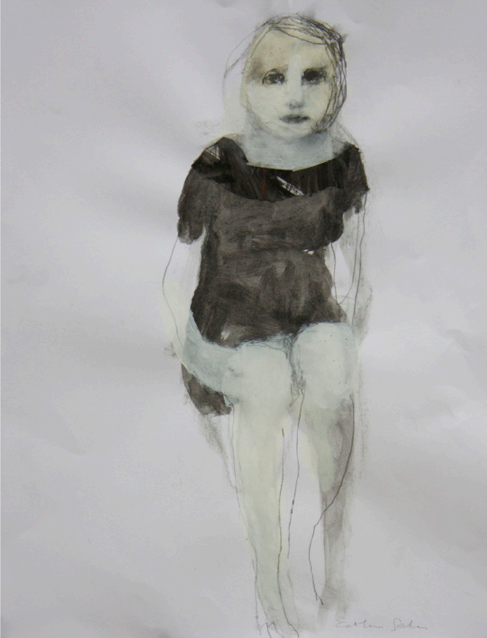
“Les yeux roires” T M sur papier 45x58cm