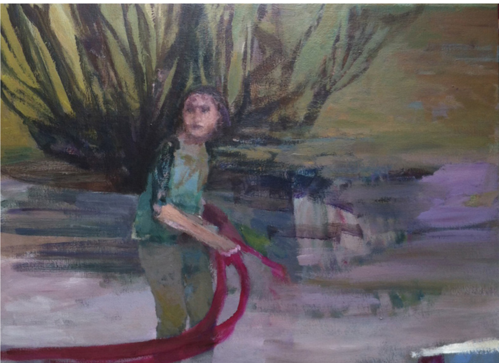
“Le ruban rouge” T M sur toile 89x116cm