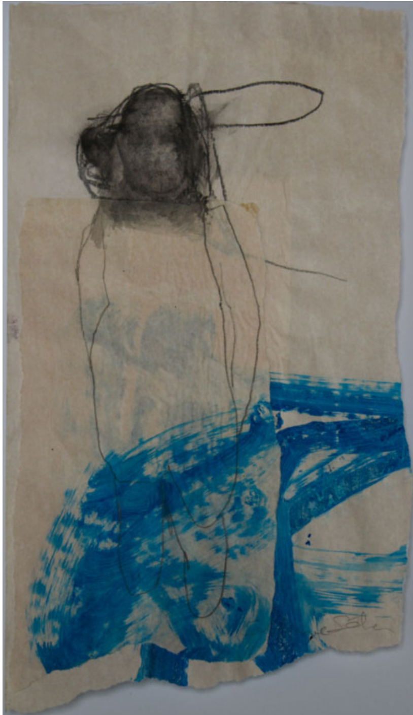
“Une fée” T M sur papier 25,5x14,5cm