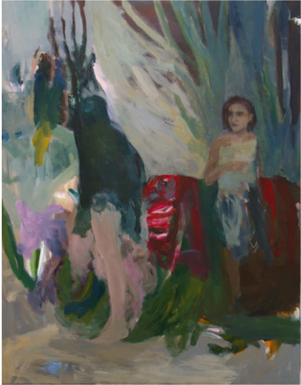
“Le chien et le perroquet” T M sur toile 114x146cm