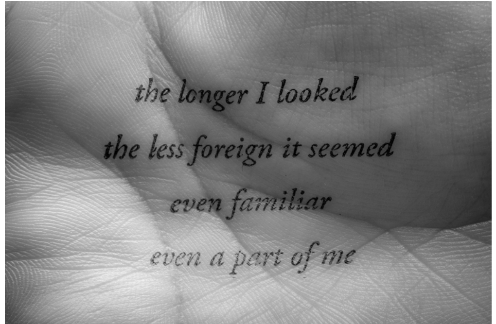
Christian Vogt, the longer I looked , 2008 Série Skinprints Tirage pigmentaire, 80 x 127 cm, édition de 3

"J'utilise différentes interactions entre les images et le texte. Toutes les pensées que j'ai exprimées dans les Skinprints, je voulais initialement les utiliser dans les Photographic notes. Mais ça ne fonctionnait pas. Certains textes perdent leur sens parce qu'on les connecte immédiatement à l'image. Parfois cela fonctionne bien et le texte et l'image se répondent - fréquemment, ce n'est pas le cas. Dans les Skinprints, par contre, les textes ont une bien plus grande autonomie que ce soit par le contenu ou par la forme."