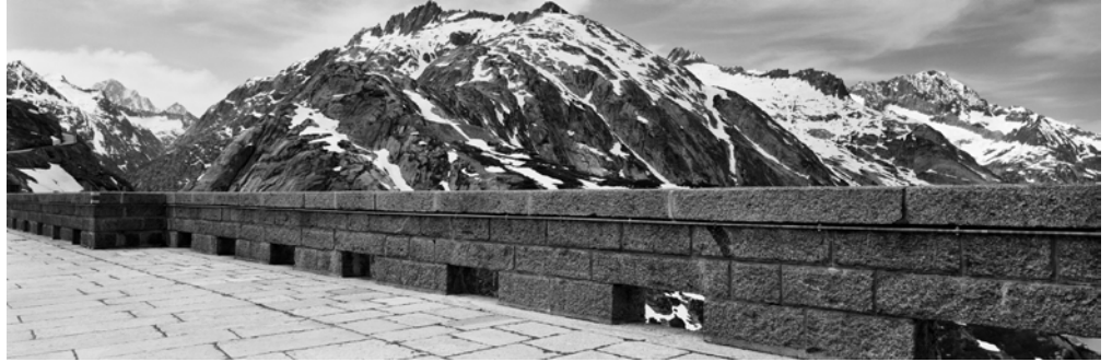
Christian Vogt, Grimsel , 2011 Tirage pigmentaire, 80 x 242 cm, édition de 3