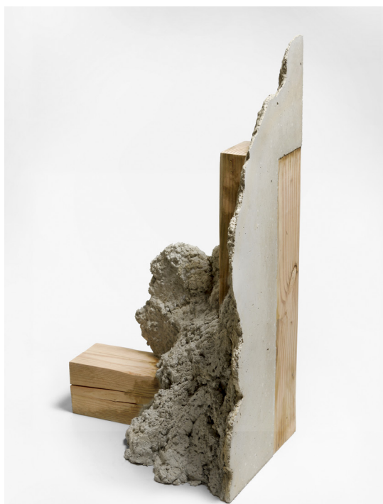
Benjamin Sabatier, Sans titre, 2016 101 x 41 x 58 cm, béton et bois photo © JP Humbert courtesy Benjamin Sabatier et galerie Catherine Issert

Le titre de la première exposition personnelle de Benjamin Sabatier à la galerie Catherine Issert révèle tout un projet en soi. Il renvoie à la technique de fabrication, au cahier des charges, au système de montage, voire à une manière d'employer son temps. De manière très pragmatique, un mode d'emploi est un document qui explique la forme particulière de construction d'un objet ou de fonctionnement d'un service. De manière programmatique également, la notice annonce le protocole auquel il va falloir se soumettre.