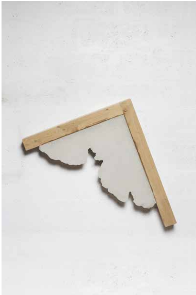
Benjamin Sabatier, Sans titre , 2016, 70 x 114 x 8 cm, béton et bois