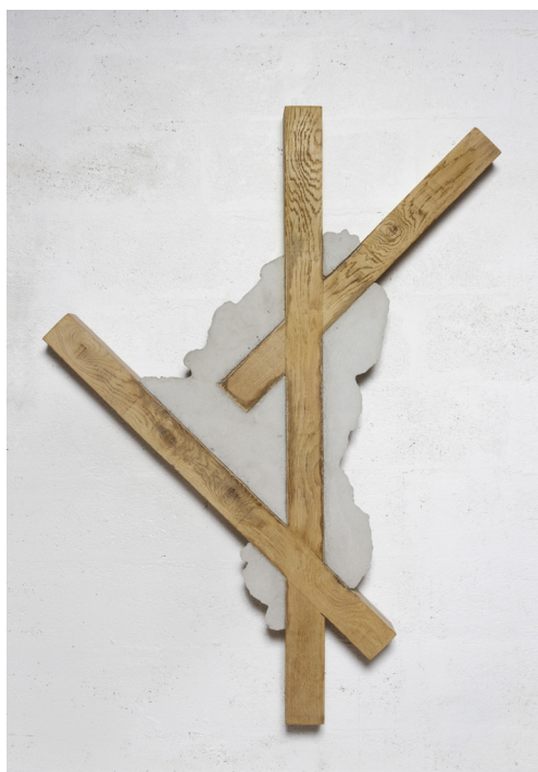
Benjamin Sabatier, Sans titre, 2015 137 x 99 x 8 cm, béton et bois

09 09 16 &gt; 29 10 16 / vernissage le vendredi 9 septembre à 18:00