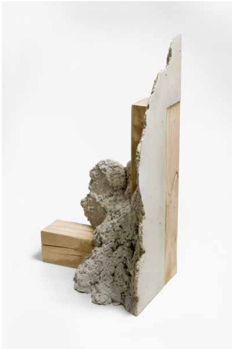
Benjamin Sabatier, Sans titre , 2016, 101 x 41 x 58 cm, béton et bois