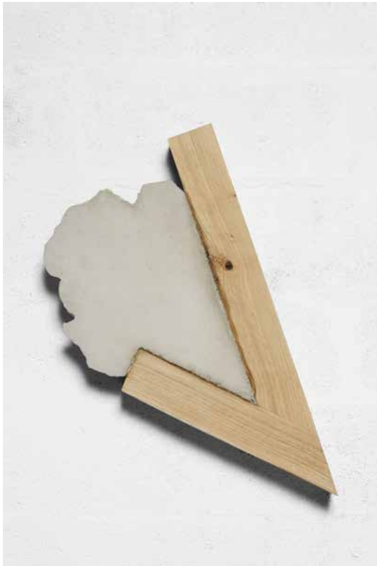
Benjamin Sabatier, Sans titre , 2016, 68 x 52 x 8 cm, béton et bois, photo © JP Humbert, courtesy Benjamin Sabatier et galerie Catherine ISSERT