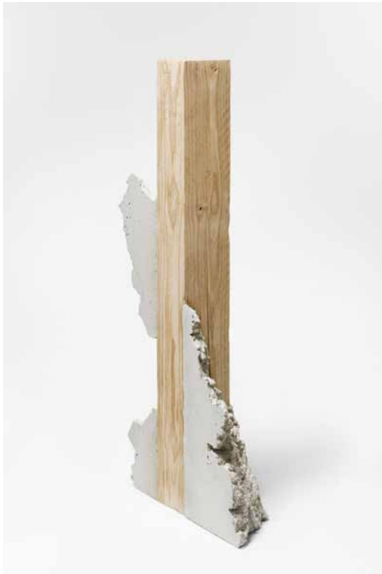
Benjamin Sabatier, Sans titre , 2016, 130 x 66 x 25 cm, béton et bois